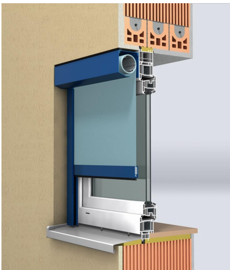
Bild 7: ZipTex ist für alle Vorbau- und Aufsatzkästen von Alukon erhältlich. Durch ein umfangreiches Farbkonzept lassen sich Kasten und Behang bestmöglich aufeinander abstimmen.