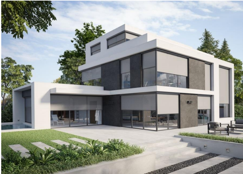
Bild 1: Sicht-, Blend- und Insektenschutz, hohe Windwiderstandswerte und eine vielfältige Farb- und Tuchoauswahl zählen zu den wichtigsten Vorteilen von textilem Sonnenschutz.